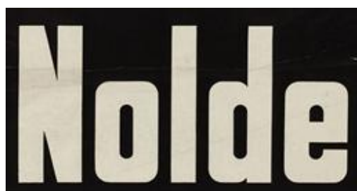
Рис. 3. Я. Чихольд. Оголошення про лекцію (фрагмент). Німеччина. 1921 р.

Чихольд вважав, що антиква з її контрастними штрихами та засічками є пережитком минулого, що заважає швидкому читанню. Найбільш функціональними, на його думку, були гротески — шрифти без засічок, позбавлені декоративних елементів. Вони забезпечували нейтральність, читабельність і універсальність. Перевага надавалася складальним гротесковим гарнітурам, які могли варіюватися за накресленнями та кеглями для виявлення смислової ієрархії. Зразком такого підходу є оголошення про лекцію (рис. 3), де використано чіткий гротеск без засічок [3].