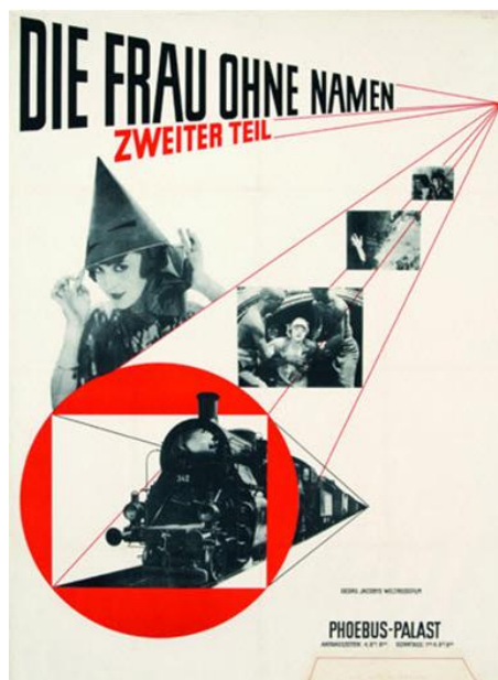
Рис. 5. Я. Чихольд. Афіша до фільму «Жінка без імені». Німеччина. 1927 р.

Усі ці принципи Чихольд згодом узагальнив у «Азбуці типографіки» (Typographische Gestaltung, 1935), яка стала настільною книгою для багатьох поколінь дизайнерів [6]. «Нова типографіка» справила значний вплив на формування швейцарської школи та міжнародного типографічного стилю, які підхопили ідеї функціональної доцільності, модульної сітки та асиметричної композиції, розвинувши їх у цілісну систему графічного проектування.