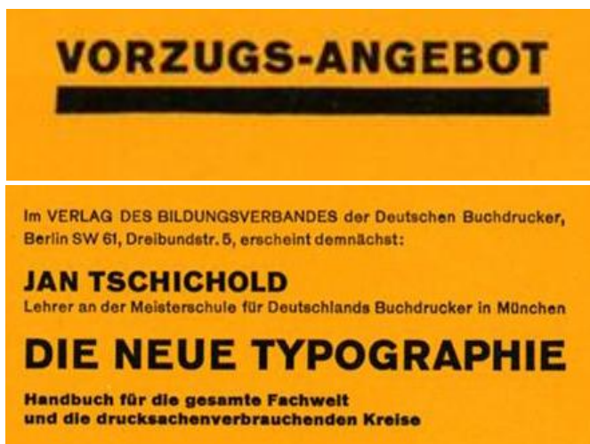
Рис. 2. Я. Чихольд. Рекламне оголошення про вихід книги «Нова типографіка» (фрагмент). Німеччина. 1928 р.

Для досягнення ясності та структурної чіткості Чихольд запропонував використання модульної сітки, яка визначала розташування всіх елементів — тексту, ілюстрацій, заголовків. Сітка не обмежувала творчу свободу, а надавала їй раціональної основи, забезпечуючи візуальну узгодженість різних елементів. Цей принцип чітко простежується у рекламних оголошеннях про вихід книги «Нова типографіка» (рис. 2), де текст організовано у чіткі прямокутні блоки [3].